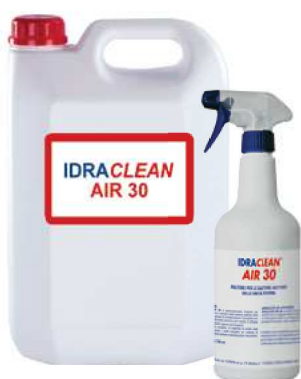
Pronto all'uso (già diluito)

CONFEZIONI IDRACLEAN AIR 30: taniche da 5 kg e 25 kg, bottiglia con erogatore da 750 ml.