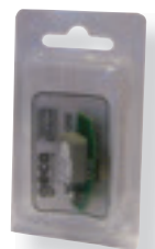
SENSORI DI RICAMBIO